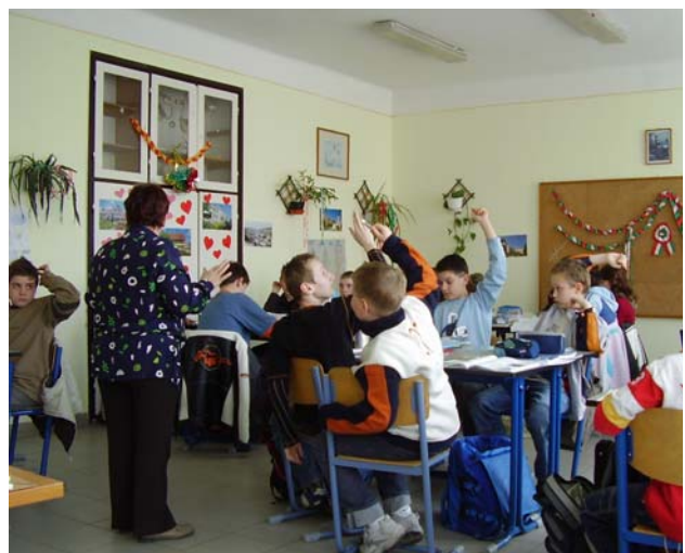
Az óra végén a tanárnő rövid kérdésekkel tájékoztodik arról, hogy megértették-e a lényeget a tanulók.