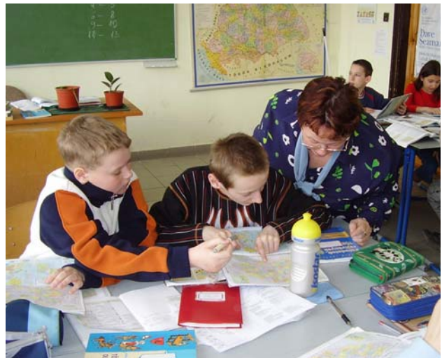
A tanárnő bátorítja a saját tapasztalatok feldolgozását; segíti kialakítani tanulói egyéni tanulási stílust.