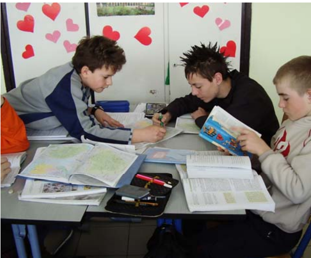
A kis csoport közösen keres megoldásokat a feladathoz.