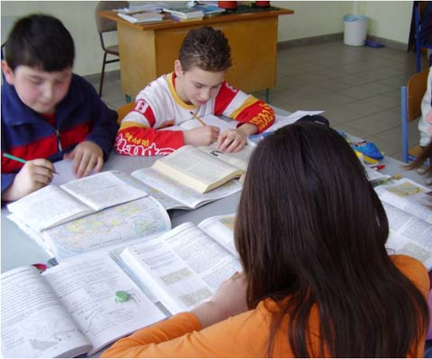
Az önálló tanulás a lecke elolvasásával kezdődik. Itt a tanár visszajelzést kap a tanuló olvasási kompetenciáiról.